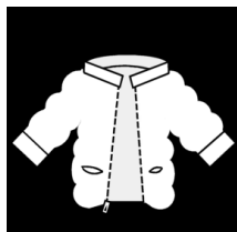
regen- of winterjas