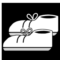
(water-) dichte schoenen